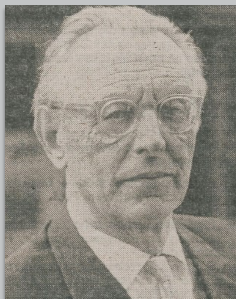
Regensburger Universitätszeitung, Jahrgang 1982, Nr. 3, Seite 6 (Universitätsarchiv Regensburg)

Orff, zu dessen bekanntesten Werken die „Carmina Burana“ gehört, interessierte sich besonders für Musikpädagogik. Das von ihm erarbeitete musikpädagogische Konzept wird als „Schulwerk“ bis heute im Musikunterricht verwendet.