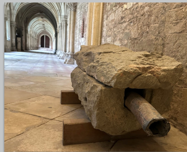
Teilstück der originalen Wasserleitung aus dem Jahr 1200

Abt Peringer dessen Grabmal in der Ramwoldskrypta von St. Emmeram die Inschrift „ qui fecit aquaeductum plumbeum “ trägt, ließ die Wasserleitung im Jahr 1200 nach altrömischer Technik anfertigen: Es wurden Bleirohre in großen Steinquadern verlegt, diese von oben wiederum mit Steinquadern abgedeckt. Zu Recht priesen die Emmeramer Mönche regelmäßig die bis heute älteste Wasserleitung Deutschlands. Sie lieferte zu jeder Zeit sauberes Wasser zum Trinken, zum Waschen, für den Fischteich und natürlich zur Brandbekämpfung.