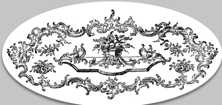
Einblattdruck (Historischer Verein für Oberpfalz und Regensburg, R2113)

Als literarische Neujahrsgratulantinnen traten im 19. Jahrhundert die Regensburger Nachtwächter auf. Am Silvesterabend zogen sie von Haus zu Haus, trugen ihre Glückwünsche vor und überreichten einen gedruckten „Neujahrsbesuch“. Eine Reihe dieser Gelegenheitsdrucke bewahrt heute die Bibliothek des Historischen Vereins. 1808 lauteten einige Verse folgendermaßen: