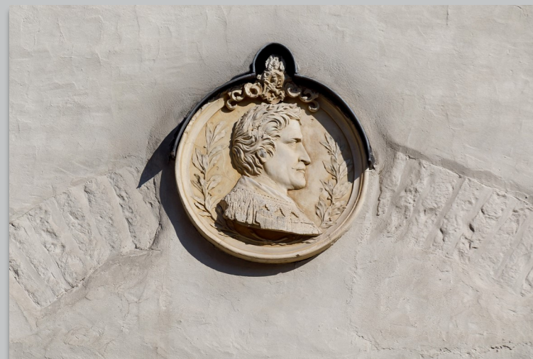
Relief Ludwigs I. am Goldenen Kreuz

Stellen wir uns vor: König Ludwig I. von Bayern wäre noch am Leben und möchte dieses Jahr auf Einladung der Stadt Regensburg und des Hauses der bayerischen Geschichte die ihm gewidmete Landesausstellung besuchen. Wo würde er Logis nehmen? Wahrscheinlich im Goldenen Kreuz, wo er seit seiner Kronprinzenzeit wiederholt übernachtete.