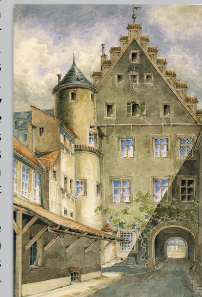
Arnulfsplatz 4, Rückansicht, Aquarell von Adolphine Beyschlag, 1892 (Museen der Stadt Regensburg, G 1950/4,4)

(Günther Handel, Stadtarchiv Regensburg)