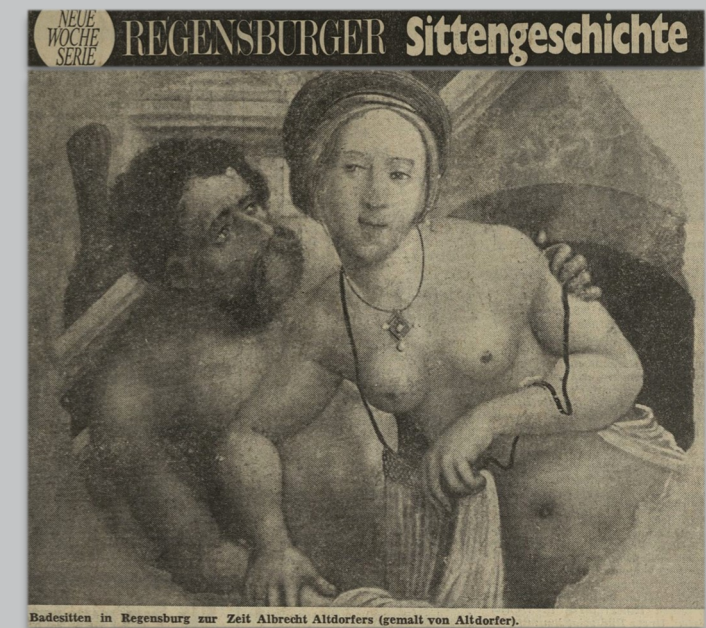
Badesitten in Regensburg zur Zeit Albrecht Altdorfers (gemalt von Altdorfer).

1969 – mitten in der Zeit der „sexuellen Revolution“, also dem Wandel der öffentlichen Sexualmoral im Sinne einer Enttabuisierung sexueller Themen – veröffentlichte die WOCHE eine siebenteilige Serie zur „Sittengeschichte in Regensburg“, die vermeintliche Tabuthemen zum Inhalt hatte: Den Anfang machten „Die Ehebrecher“, „illustriert“ von Altmeister Albrecht Altdorfer :