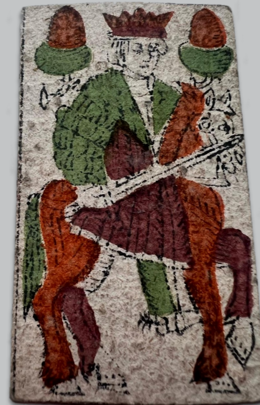
Hauptrechnung 1604/05

Mal finden sich zerquetschte Fliegen aus der Frühen Neuzeit, ein andermal gepresste Blütenblätter; nicht selten eingelegte Notizzettel oder Quittungen. Einen besonderen Fund hingegen machte eine studentische Mitarbeiterin beim Einscannen der Hauptrechnung des Spitals von 1604/05: